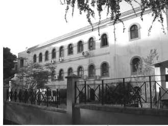
L'hôpital, côté magasins. État actuel (2007).

barils de lard pourri et des sacs de biscuits en décomposition. « Quels effluves abondants ont été vomis pendant plus d'une année par la bouche béante de ce cloaque infectieux ! », s'exclame-t-il. Il fait vider et nettoyer les magasins, et l'infection cesse.