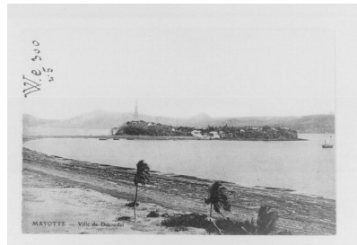
Le « rocher » de Dzaoudzi (carte postale ancienne). Publication avant 1928.